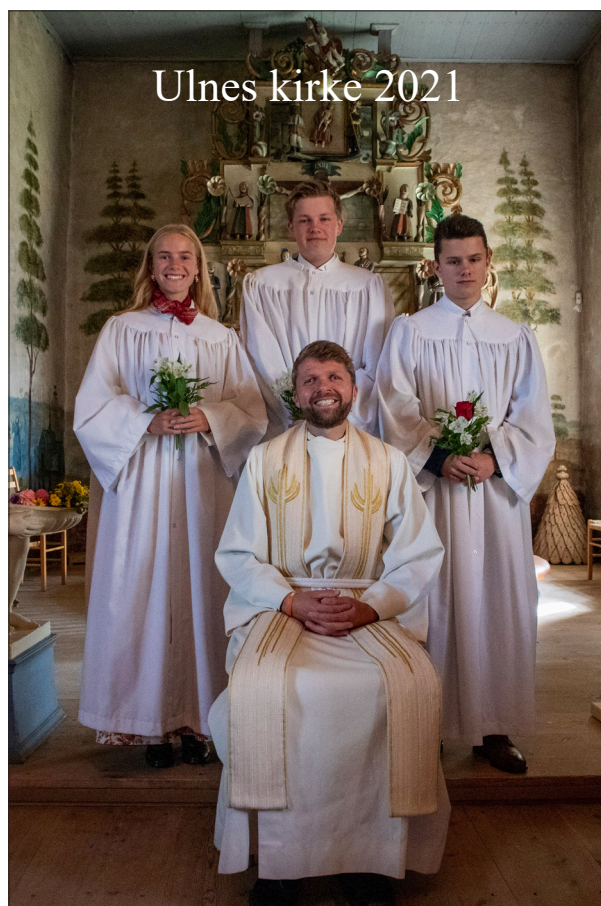
Ulnes kirke 2021