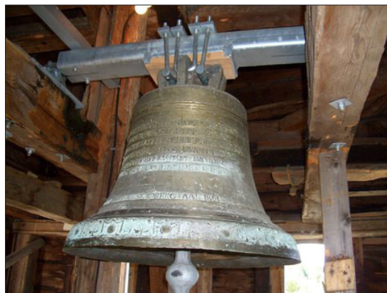
Den eldste klokka