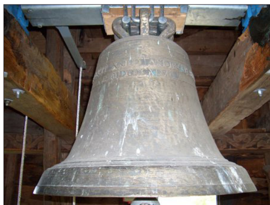
Den yngste klokka