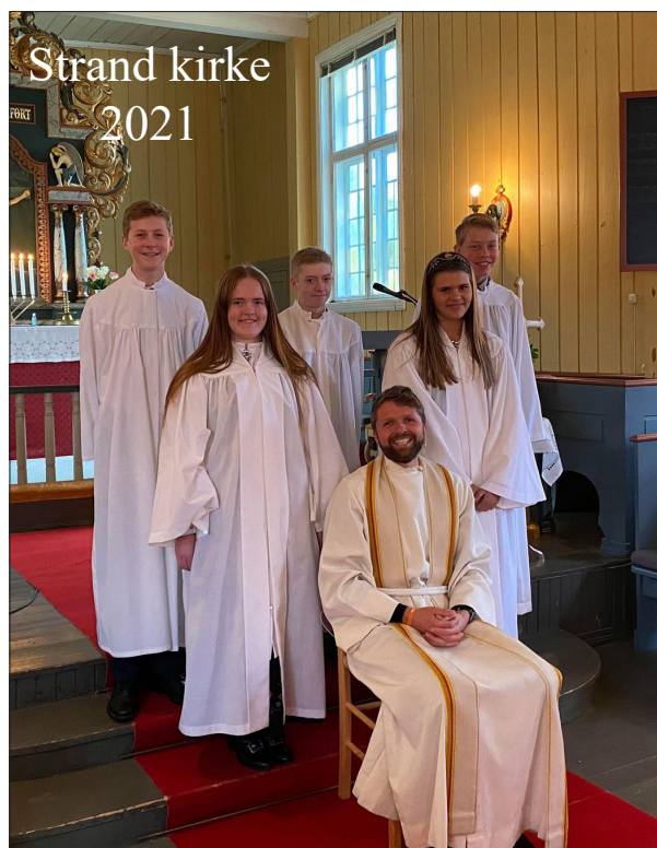
Strand kirke 2021