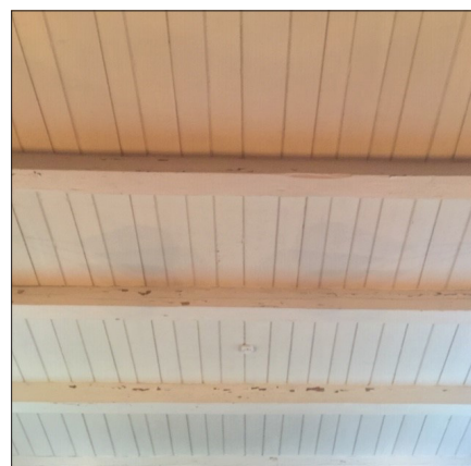
Taket trenger også en oppfriskning!