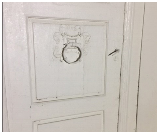
Dør-ringen er det eneste minnet som finnes fra den gamle stavkirken som sto på Svenes.