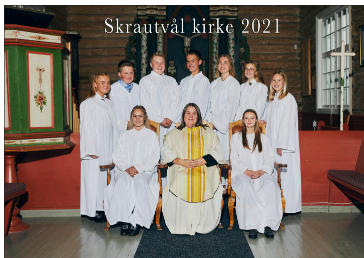
Skrautvål kirke 2021