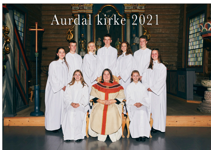
Aurdal kirke 2021