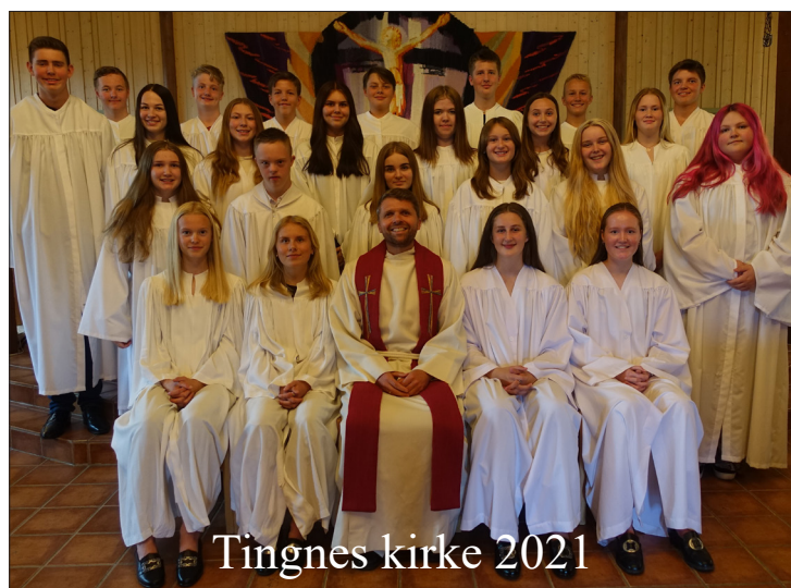
Tingnes kirke 2021